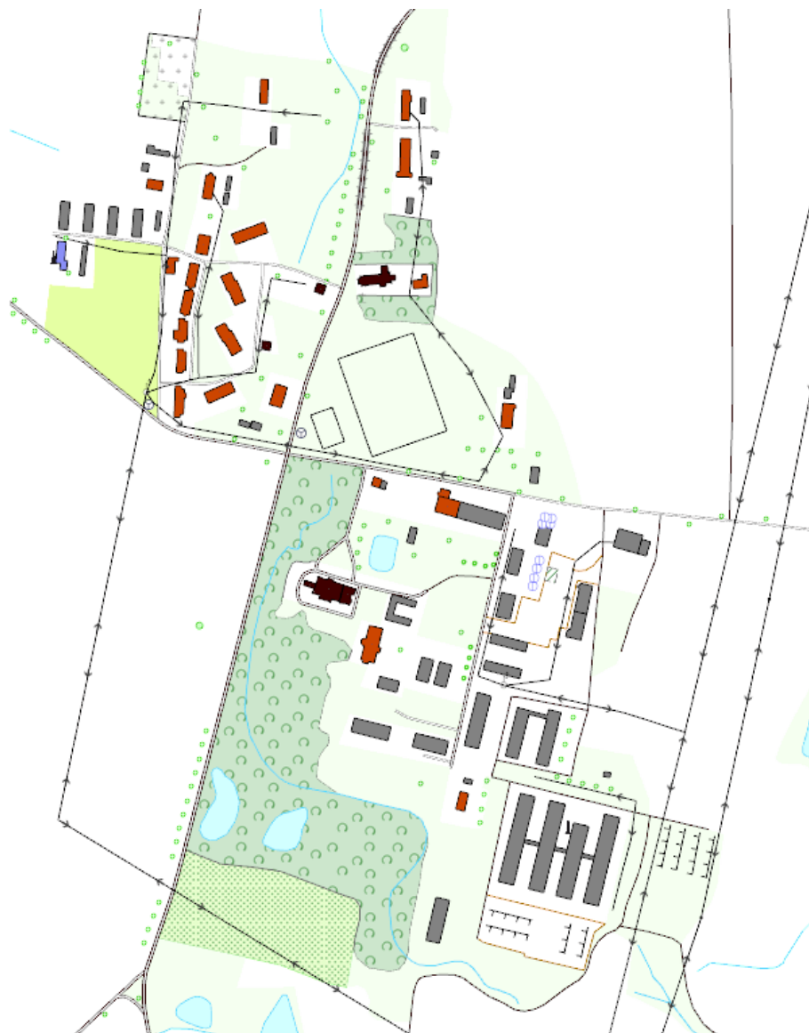
Schemat: Układ przestrzenny wsi Bałszyce – wykorzystano mapę z www.geoportal.gov.pl