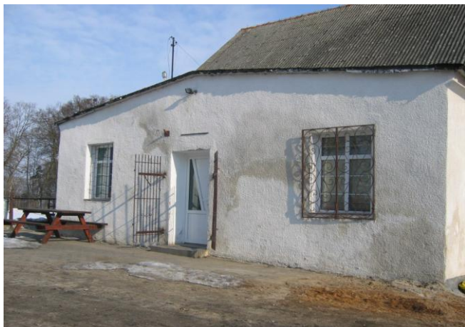
(Świątelnia w Ulnowie)