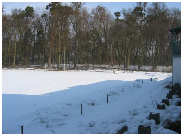
(Boisko sportowe – stan obecny)